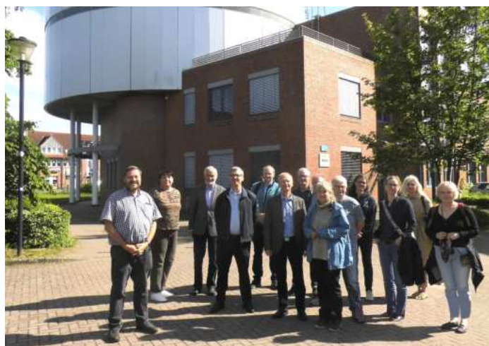
Abbildung 1: Delegierte des vhw-MV vor dem MSCW

Einmal jährlich legt der Landesvorstand satzungsgemäß Rechenschaft über die geleistete Arbeit des vorangegangenen Jahres ab, berichtet über die Verwendung der finanzi-