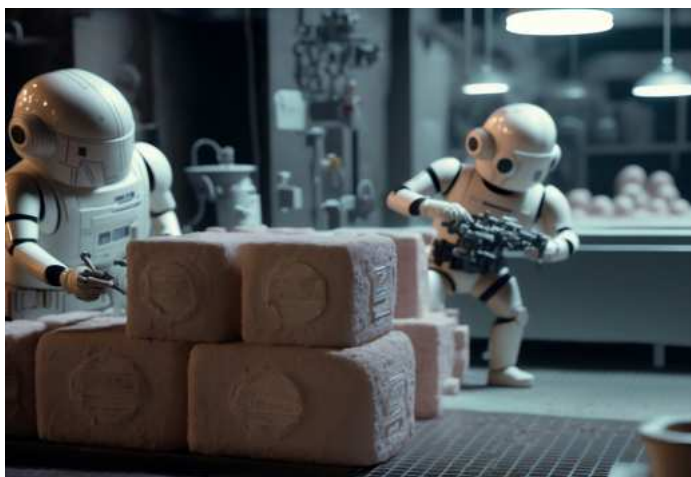
Abbildung 3: KI-Systeme sind klar zu definieren: Es sind künstliche Systeme.

Deshalb sind KI-Systeme klar zu definieren. Dabei handelt es sich um künstliche Systeme (Maschinen). Es muss deutlich werden, was die jeweiligen KI-Systeme von einfachen herkömmlichen Softwaresystemen und Programmieransätzen unterscheidet. Hierbei sind nicht Systeme gemeint, die ausschließlich dem automatischen Ausführen von Operationen nach von natürlichen Personen definierten Regeln dienen. Vielmehr betrachten wir hier Systeme, die selbst Schlussfolgerungen auf der Basis von Daten ziehen können, lernfähig sind, logik- und wissensgestützte Konzepte nutzen und modellieren können.