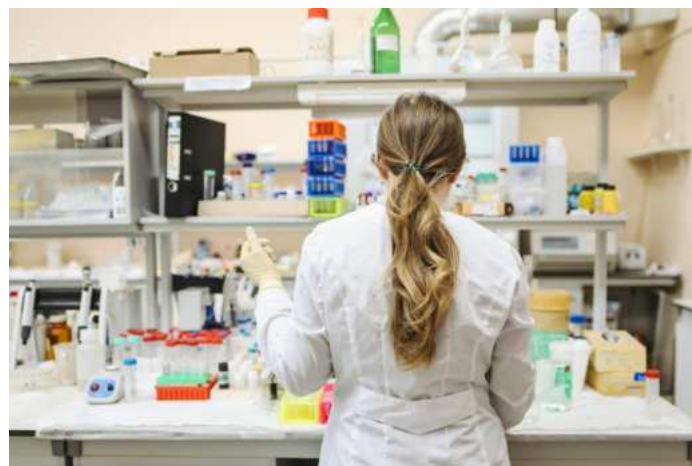
Abbildung 1: Wissenschaftliche Hilfskraft bei der Laborarbeit.

Erste Erfahrungen zeigen, dass die Zahl der Ausnahmeanträge die Mehrheit werden könnten, so dass die Regelhaftigkeit nicht erreicht würde. Dabei werden am meisten genannt, der Einsatz in Drittmittelprojekten, die weniger als ein Jahr Restlaufzeit haben, der Einsatz als Tutoren lediglich in einem Semester bzw. ausschließlich während der Vorlesungszeit und immer häufiger nun auch der eigene Wunsch der Hilfskraft.