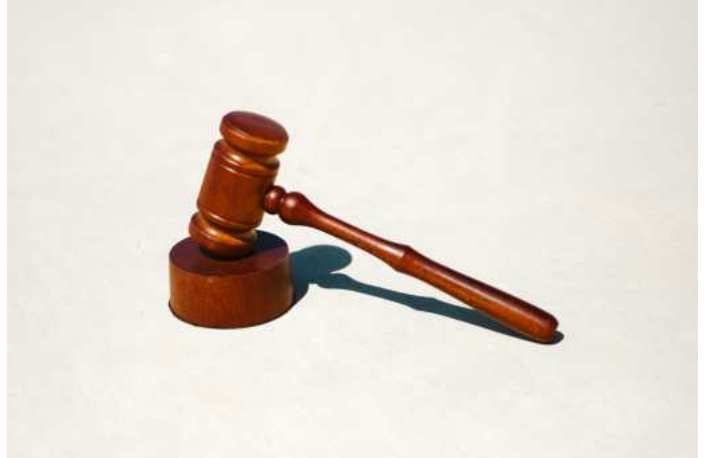
Abbildung 2: Die Europäische Kommission kann Gesetzesvorschläge einbringen, über die dann der Ministerrat und das Europäische Parlament dann verhandeln.

Die EU möchte und wird in diesem Prozess eine Vorreiterrolle einnehmen.