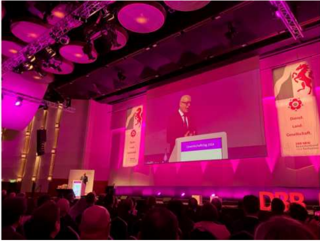
Abbildung 1: Gewerkschaftstag des DBB NRW in Neuss