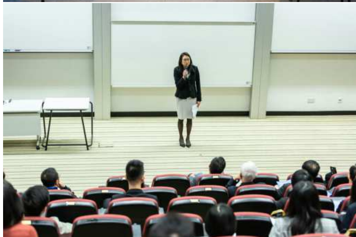
Abbildung 1: Wenn die Klassenräume aufgrund der Schulferien verwaist sind, finden an den Hochschulen noch Vorlesungen statt

Auch auf der Seite der Schulen haben sich die Gegebenheiten leicht verschoben: Eine gewisse Anwesenheit während der Ferien wird inzwischen von vielen Lehrkräften verlangt. Oft gibt es eine Anwesenheitspflicht in der letzten Woche der Sommerferien. Im Osten Deutschlands finden zudem die Einschulungen bereits am Samstag vor dem ersten Schultag statt, dabei sind oft auch höhere Schulklassen involviert.